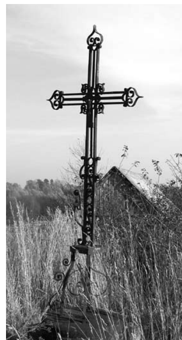
Tikriausiai dar baudžiamos metais statytas kryžius taip pat jau reikalauja priežiūros ir aplinkos sutvarkymo.