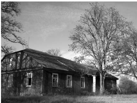
Savičiūnų dvaro gyvenamasis namas iš fasadinės pusės dar visai pakenčiamai atrodo.