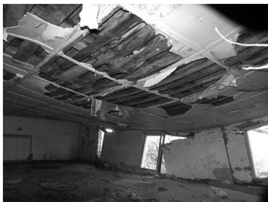
Deja, kita namo pusė visiškai sugriuvusi: sukritę vidun lubos, sienos, langai ir durys.